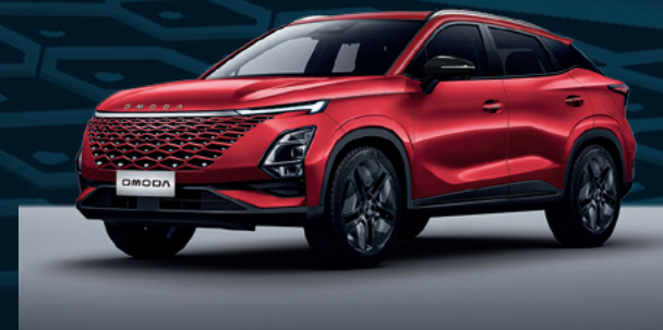
Blood Red Dla wersji Comfort i Premium