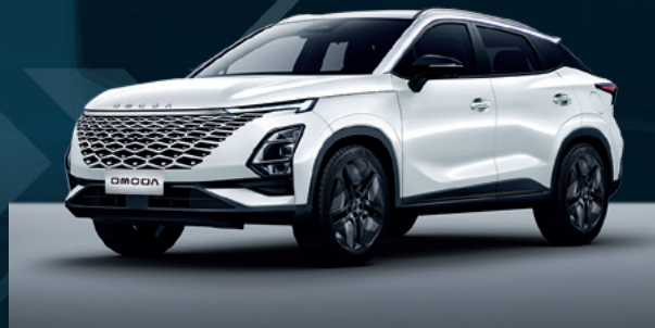
Khaki White Dla wersji Comfort