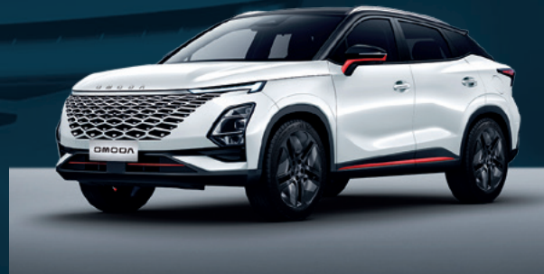
Khaki White z czerwonymi akcentami i czarnym dachem Dla wersji Premium