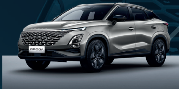
Aviation Silver Dla wersji Comfort

I co najważniejsze, niezależnie jaki kolor wybierzesz, nie dopłacasz za niego.