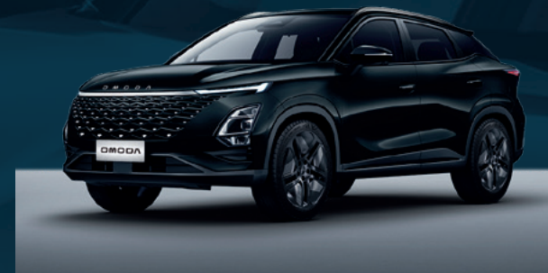
Carbon Black Dla wersji Comfort i Premium