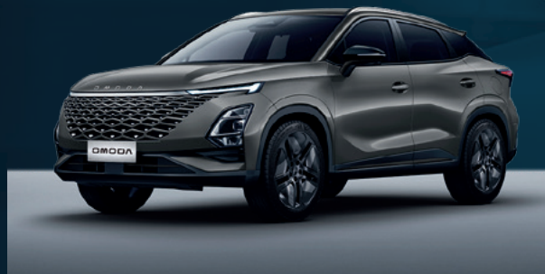
Phantom Gray Dla wersji Comfort