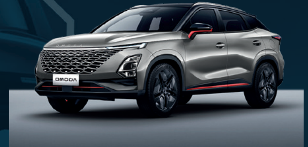
Aviation Silver z czerwonymi akcentami i czarny dachem Dla wersji Premium