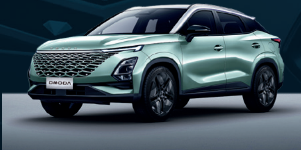
Aqua Green z białym dachem Dla wersji Premium

Czerwone elementy znajdują się na podstawach lusterek bocznych, dolnej kracie wlotu powietrza oraz na listwach bocznych drzwi