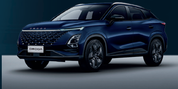
Midnight Blue Dla wersji Comfort i Premium