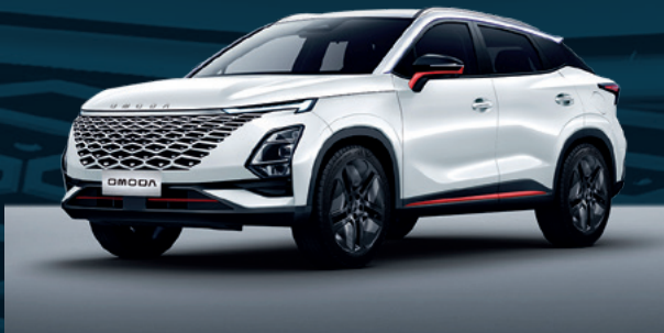
Khaki White z czerwonymi akcentami Dla wersji Premium