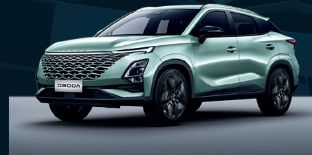
Aqua Green Dla wersji Comfort i Premium